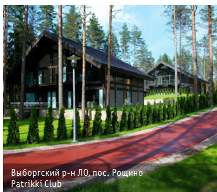
Выборгский р-н ЛО, пос. Роцино Patrikki Club