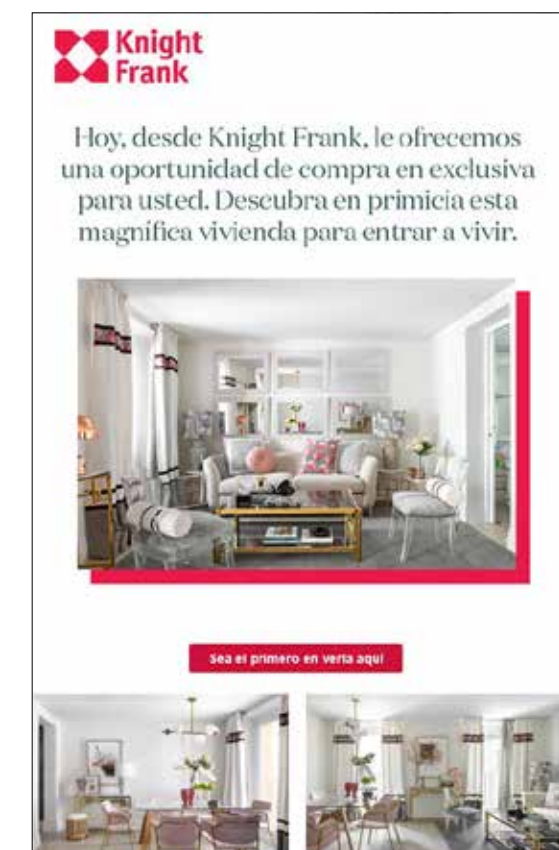
▶ Email directo a compradores activos