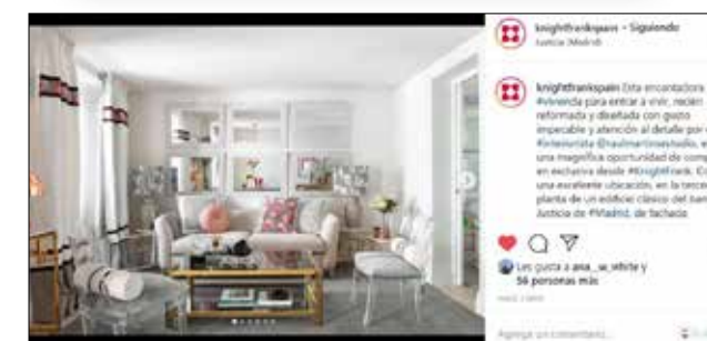
▲ Redes sociales con alcance local e internacional